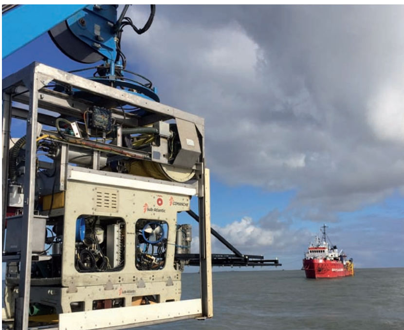
Abb. 3: ROV »Comanche«

Diese herausragenden Bedingungen am Standort Rostock stellen für die gesamte maritime Industrie eine wertvolle Ressource zur effizienten Entwicklung und Erprobung von Unterwassertechnologien und -fahrzeugen dar. Umso mehr werden Wirtschaft und Wissenschaft von den geplanten Erweiterungen rund um den Innovationscampus profitieren. ↕